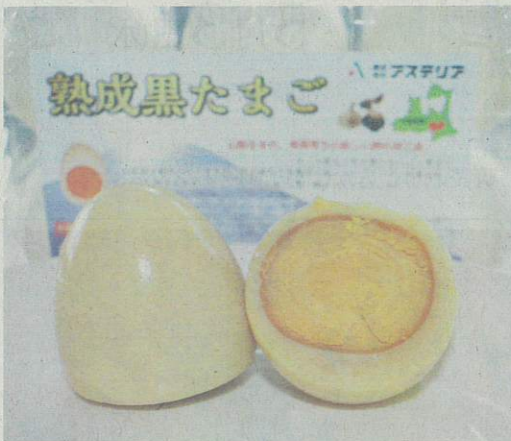
黒にんにくにヒントを得た特許製法を活用し、アステリアが商品化した「熟成黒たまご」